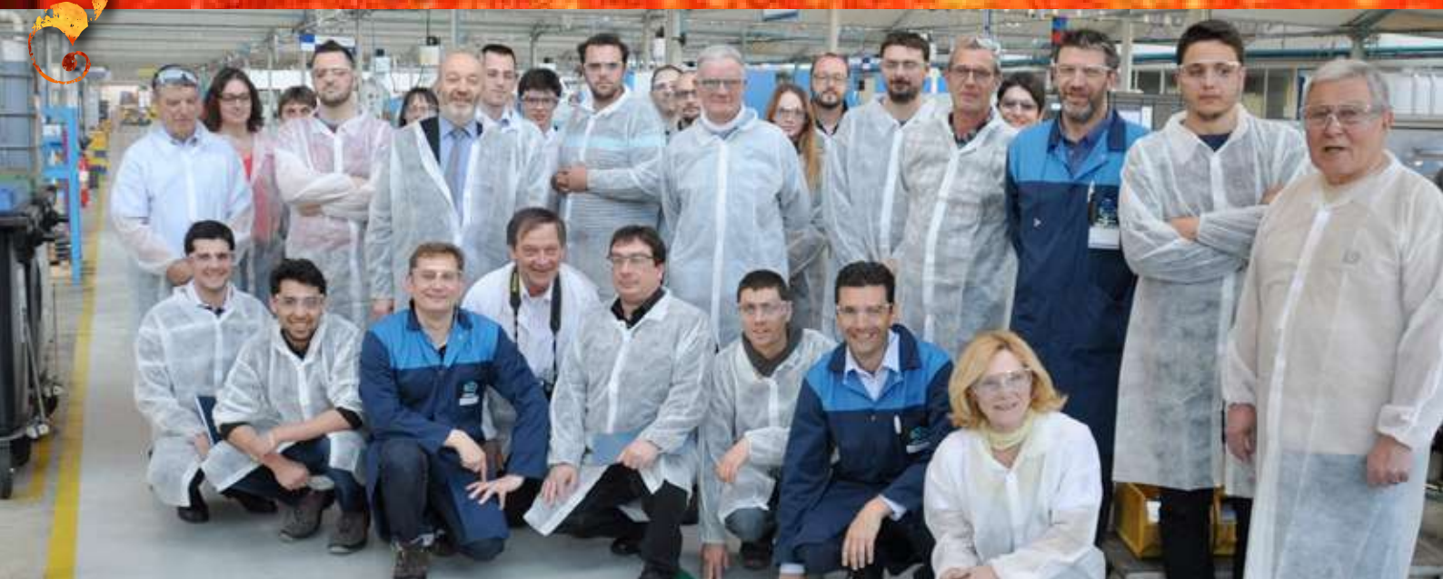
Manifestement tous les participants ont le sourire après cette captivante visite.