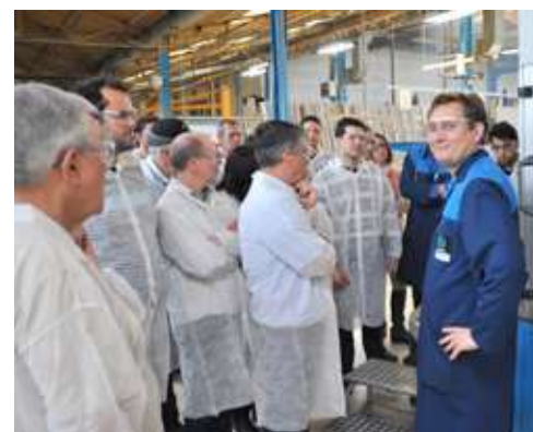
Un collaborateur AFSR nous explique le changement d'outil

Le groupe suit une opération de frappe à froid